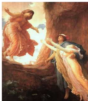
Perséphone ramenée des Enfers par LEIGHTON

"Paix à présent. Donne aux hommes la vie qui ne leur vient que de toi."